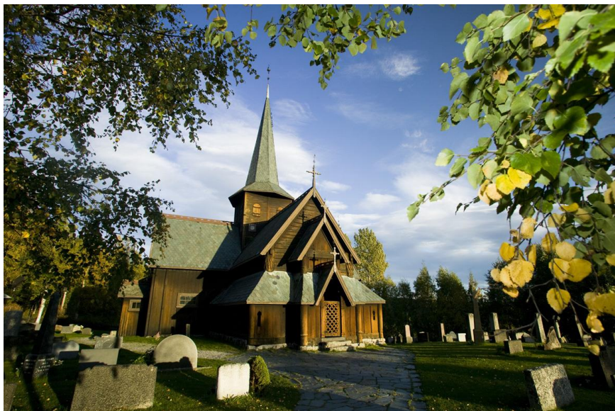
Figur 4. Hedalen stavkirke ligger i sørenden av Pilegrimsvegen gjennom Valdres.

Det kan også være aktuelt med kirker utenfor Pilegrimsvegen, men med en gangbar kobling via andre vandreveger som Kongevegen eller Prestevegen. Aktuelle kan være Bruflat eller Volbu. Ved Bruflat er det allerede en kultursti. Dette er en kirke fra 1700-tallet som også har omvisningstjeneste. Bruflat er også koblet til Pilegrimsvegen med Kongevegen over Tonsåsen.