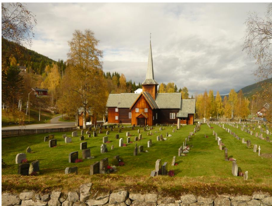
Figur 5. Bruflat kirke

Det kan også være aktuelt med kirker utenfor Pilegrimsvegen, men med en gangbar kobling via andre vandreveger som Kongevegen eller Prestevegen. Aktuelle kan være Bruflat eller Volbu. Ved Bruflat er det allerede en kultursti. Dette er en kirke fra 1700-tallet som også har omvisningstjeneste. Bruflat er også koblet til Pilegrimsvegen med Kongevegen over Tonsåsen.