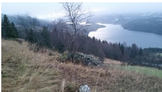
Figur 3: Til venstre: Lomen stavkirke ligger langs Pilegrimsvegen og lett synlig fra E 16. Fra kirken går flere korte og lengre ruter. Til Høyre: Her ved rydningsrøys ved Rengestad. Fra befarings på rundtur ved Lomen stavkirke

Aktuell pilot 2 bør har andre forutsetninger enn pilot 1. Det kan være kirker langs Pilegrimsvegen som har mulighet for rundturer og opplevelser i kulturmiljøet, for eksempel Reinli eller Hedalen.