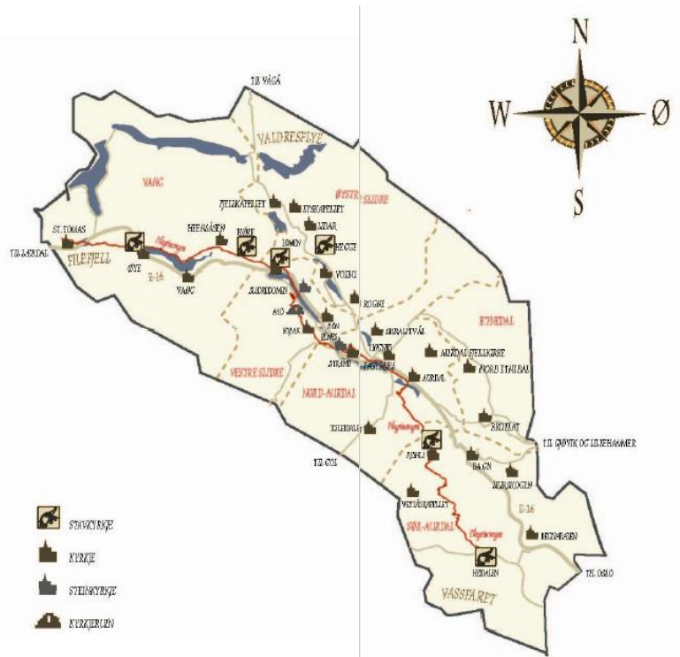
Figur 2. Kirkepasset har kart og en side med tekst og bilde for hver kirke i Valdres